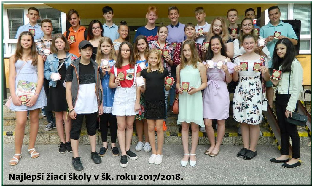
Najlepší žiaci školy v šk. roku 2017/2018.